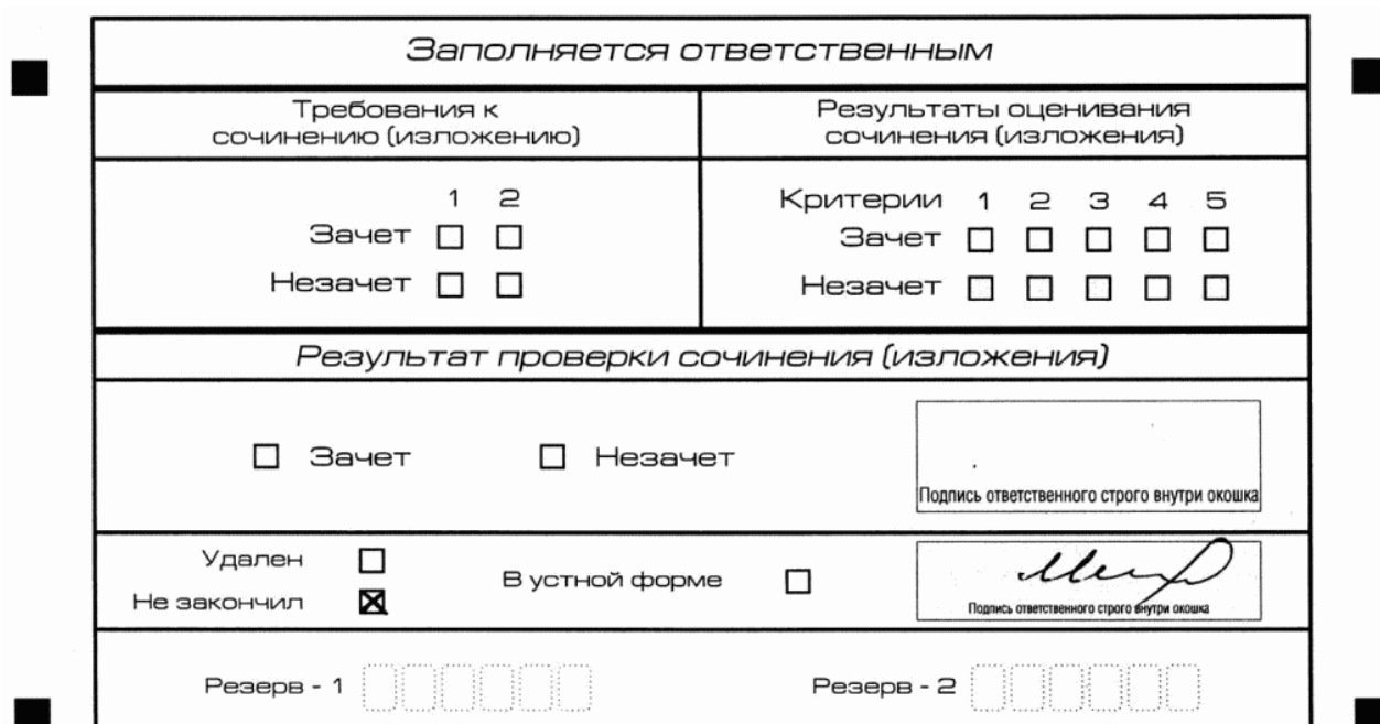
Рис. 12. Заполнение полей нижней части бланка регистрации (участник не закончил написание сочинения (изложения) по уважительным причинам)

написания итогового сочинения (изложения) по уважительным причинам" (форма ИС-08), вносят соответствующую отметку в форму ИС-05 "Ведомость проведения итогового сочинения (изложения) в учебном кабинете ОО (месте проведения)" (участник итогового сочинения (изложения) должен поставить свою подпись в указанной форме). В бланке регистрации указанного участника итогового сочинения (изложения) необходимо внести отметку "X" в поле "Не закончил" для учета при организации проверки, а также для последующего допуска указанных участников к повторной сдаче итогового сочинения (изложения) в дополнительные сроки. Внесение отметки в поле "Не закончил" подтверждается подписью члена комиссии по проведению итогового сочинения (изложения) (см. рис. 12).